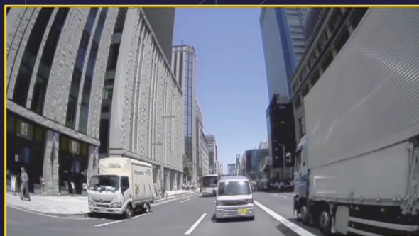
純正バックカメラ接続で後方録画をプラス！